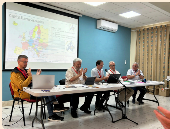
Bureau de l'AG du 26 mai