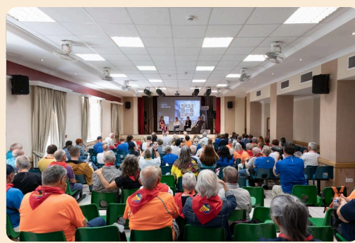
Une assemblée en séance de travail